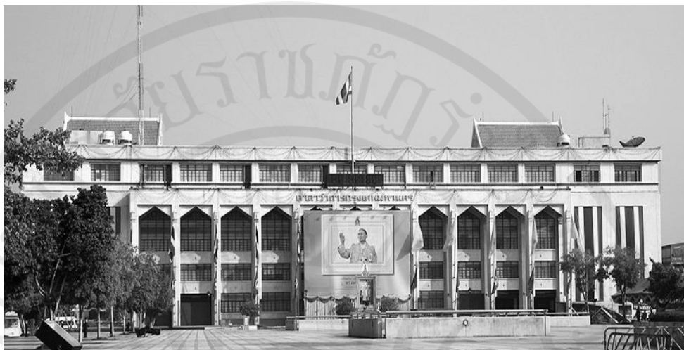
ภาพที่ 8.1 ภาพศาลาว่าการกรุงเทพมหานคร