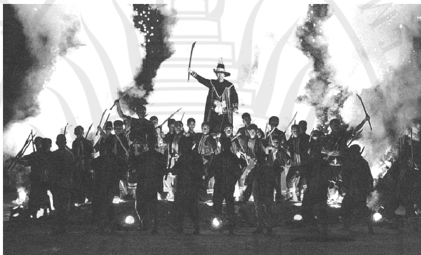
ภาพที่ 3.2 ภาพผู้ปกครองในสมัยกรุงศรีอยุธยาของไทยเปรียบเสมือน “สมมติเทพ”

ในแง่ของการปกครองท้องถิ่นการปกครองแบบหัวเมืองประเทศราชเช่นเดียวกับยุคสมัยอาณาจักรกรุงสุโขทัยซึ่งใช้หลักการบริหารแบบรวมอำนาจ(Centralization)แต่ได้ให้อำนาจแก่หัวเมืองประเทศราชได้ปกครองตนเองโดยมิได้เข้าไปควบคุมมากนักเห็นได้จากการที่กษัตริย์แต่งตั้งเชื้อพระวงศ์หรือเจ้านายที่เป็นชนพื้นเมืองปกครองตามเดิมโดยมิได้ยุ่งเกี่ยวกับราชการงานใดของหัวเมืองประเทศราชนั้น นับว่าเป็นการมอบความเป็นอิสระให้กับหัวเมืองได้ปกครองตนเองตามเจตนาารมณ์ของราชฎรในหัวเมือง หรือ ท้องถิ่นแฉกเช่นเดียวกับในอาณาจักรสุโขทัย (ลิขิต ธีรเวคิน, 2544:34-35)