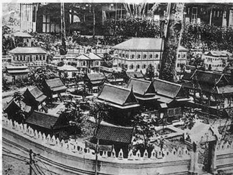
ภาพที่ 3.3 ภาพเมืองสุโขทัย ในสมัยรัชกาลที่ 6

การปกครองท้องถิ่นของไทยในรูปของ“สุขาภิบาล”ดำเนินกิจการเรื่อยมาจนถึงรัชสมัยของพระบาทสมเด็จพระปกเกล้าเจ้าอยู่หัว(ร.7)พระองค์ได้ทรงดำเนินการปกครองส่วนท้องถิ่นในรูปของเทศบาลต่อจากรัชกาลที่ 6 แต่ทว่ายังมีได้ดำเนินการเป็นผลสำเร็จเพราะประเทศไทยได้เกิดการเปลี่ยนแปลงการปกครองจากระบอบสมบูรณาญาสิทธิราชย์มาเป็นการปกครองระบอบประชาธิปไตยในวันที่ 24 มิถุนายนพ.ศ.2475(เฉลิมพงศ์ มีสมนัย. 2548:121-124)