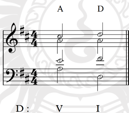
ภาพที่ 7.1 จุดพักรรคเพลงปิดแบบสมบูรณ์ในบันไดเสียงเมเจอร์

1. จุดพักรรคเพลงปิดแบบสมบูรณ์ (Perfect Authentic Cadence) เป็นจุดพักรรคเพลงที่มีการดำเนินคอร์ดจาก V, โดมิแนนท์ (Dominant) สู่ออร์ด I, โทนิค (Tonic) ในบทเพลงบันไดเสียงเมเจอร์ (Major Scale) และเป็นจุดพักรรคเพลงที่มีการดำเนินคอร์ดจาก V, โดมิแนนท์ (Dominant) สู่ออร์ด i, โทนิค ในบทเพลงในบันไดเสียงไมเนอร์ (Minor Scale) โดยที่คอร์ดทั้งสองต้องอยู่ในรูปพื้นฐาน คือ โน้ตในแนวเบสจะดำเนินจากโดมิแนนท์สู่โทนิค ซึ่งจุดพักรรคเพลงชนิดปิดแบบสมบูรณ์นี้ให้ความรู้สึกการดำเนินคอร์ดจบได้หนักแน่นมีและน้ำหนักมากที่สุด นักประพันธ์จึงนิยมใช้กับประโยคเพลงที่แสดงการจบตอน จบท่อน หรือจบบทเพลง ดังเช่นภาพที่ 7.1 ภาพที่ 7.2 และภาพที่ 7.3