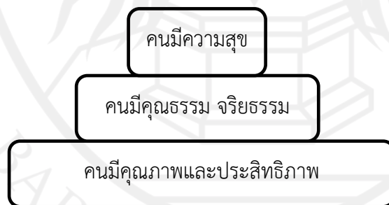
ภาพที่ 5.2 เป้าหมายของการพัฒนาคน

การทำให้คนมีคุณภาพและประสิทธิภาพมีความพร้อมในการพัฒนา และการสร้างเสริมคนให้มีความรู้จริยธรรมตามแนวทฤษฎีของศาสตร์ของแต่ละคน รวมไปถึงการสร้างคนให้มีความสุข นับว่าเป็นพื้นฐานสำคัญของการที่จะสร้างชุมชนให้เข้มแข็งและพัฒนาในลำดับต่อไป