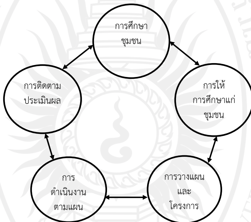
ภาพที่ 5.4 กระบวนการพัฒนาชุมชน

สรุปได้ว่ากระบวนการพัฒนาชุมชนดังกล่าวข้างต้นมีความเกี่ยวเนื่องและสัมพันธ์กันอย่างเป็นขั้นตอน ซึ่งจะต้องดำเนินการอย่างเป็นลำดับไม่ควรข้ามขั้นตอนใดขั้นตอนหนึ่ง